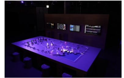
参考：「かぞくっち」（菅野創+加藤明洋+綿貫岳海、2022 年、SusHi Tech Tokyo）