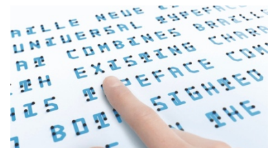
参考：「Braille Neue」（2019年、渋谷区役所、Panasonic Center Tokyo 他）