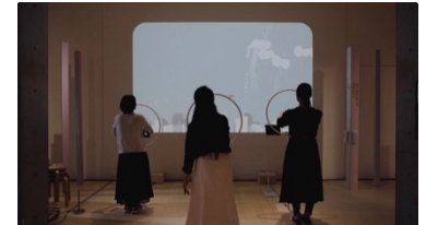
参考：「An Image of...」(Natsumi Wada, Yasuaki Kakehi, 2021年、21_21 DESIGN SIGHT)