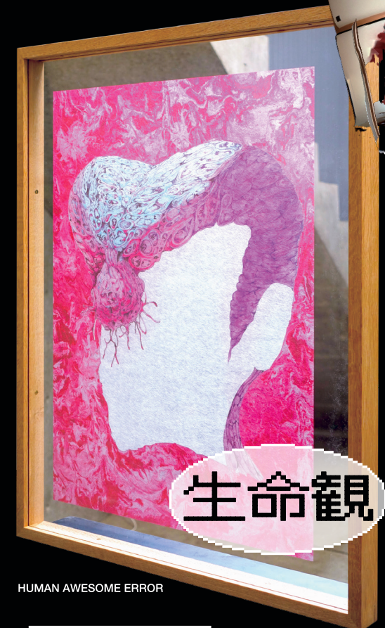
HUMAN AWESOME ERROR