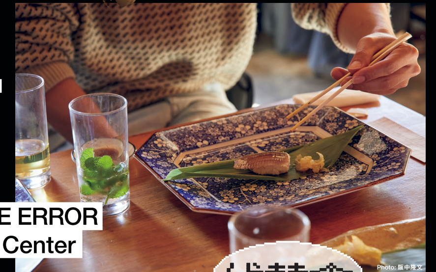
Shibata Yusuke + Token Art Center