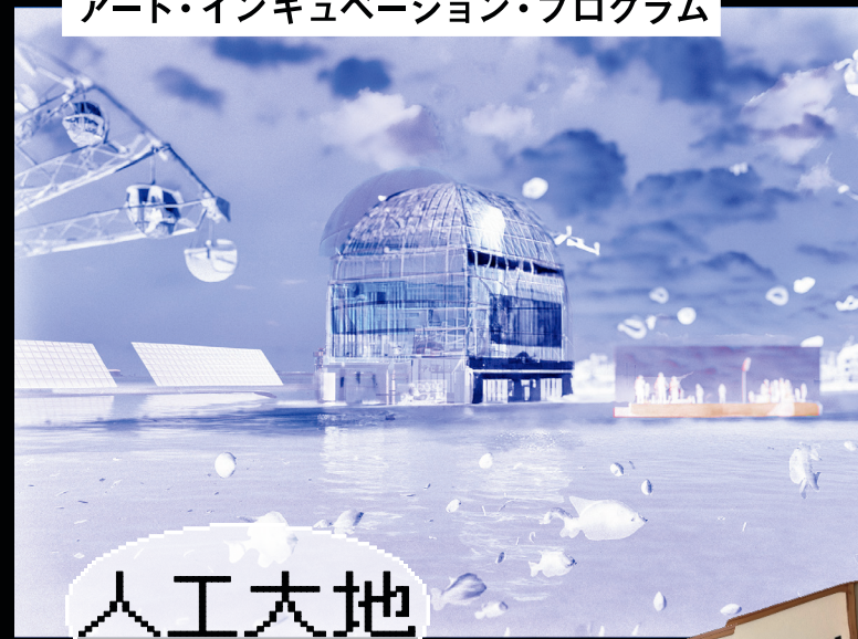
人工大地 Fuse Rintaro