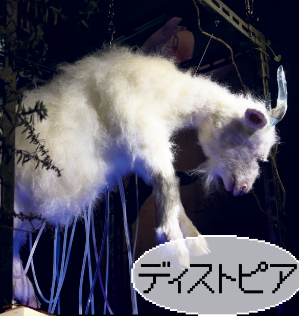
ディストピア Ichihara Etsuko