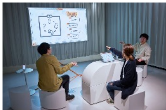
木原共 + Playfool 「Deviation Game ver 1.0」