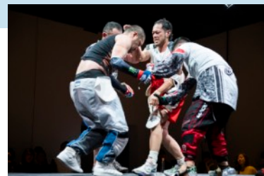
contact Gonzo 'my binta, your binta // lol ~ roars from the skinland ~'

STSの特設ステージでは、アーティストによるライブパフォーマンスと、「未来の運動会」を開催します。contact Gonzoが身体の接触を超増幅させて会場に響かせたり、ELECTRONICOS FANTASTICOS!が家電を改造した「電磁楽器」を演奏。さらに、ゲストアーティストの明和電機のライブでは、お寿司の楽器も登場！パフォーマンスやライブで使われる楽器やデバイスは、アーティストが制作したオリジナルです。アートとテクノロジーの創意工夫を、身体表現、音楽ライブでお楽しみいただけます。