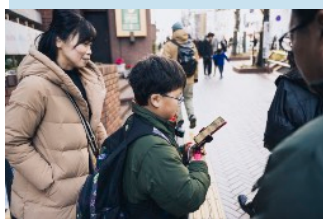
TMPR 「動点観測所 (35.39.36.02/139.42.5.98)」