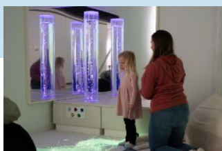
スヌーズレン・ラボ 展示「みて・さわって・きいて 一感じてあそぶスヌーズレン・ラボ」